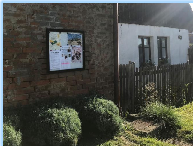
Horní Bačalky a Lično mají nové vývěsní skříňky.